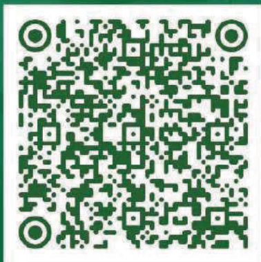
ANEXO 9 FORMATO VINCULACIÓN CLIENTES Y PROVEEDORES