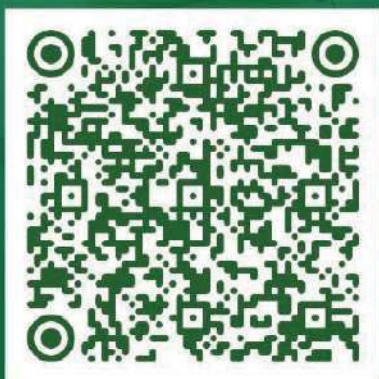
ANEXO 9 FORMATO VINCULACIÓN CLIENTES Y PROVEEDORES