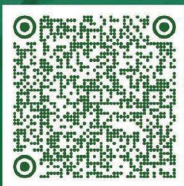
ANEXO 11 FORMATO DE CONOCIMIENTO PEPS